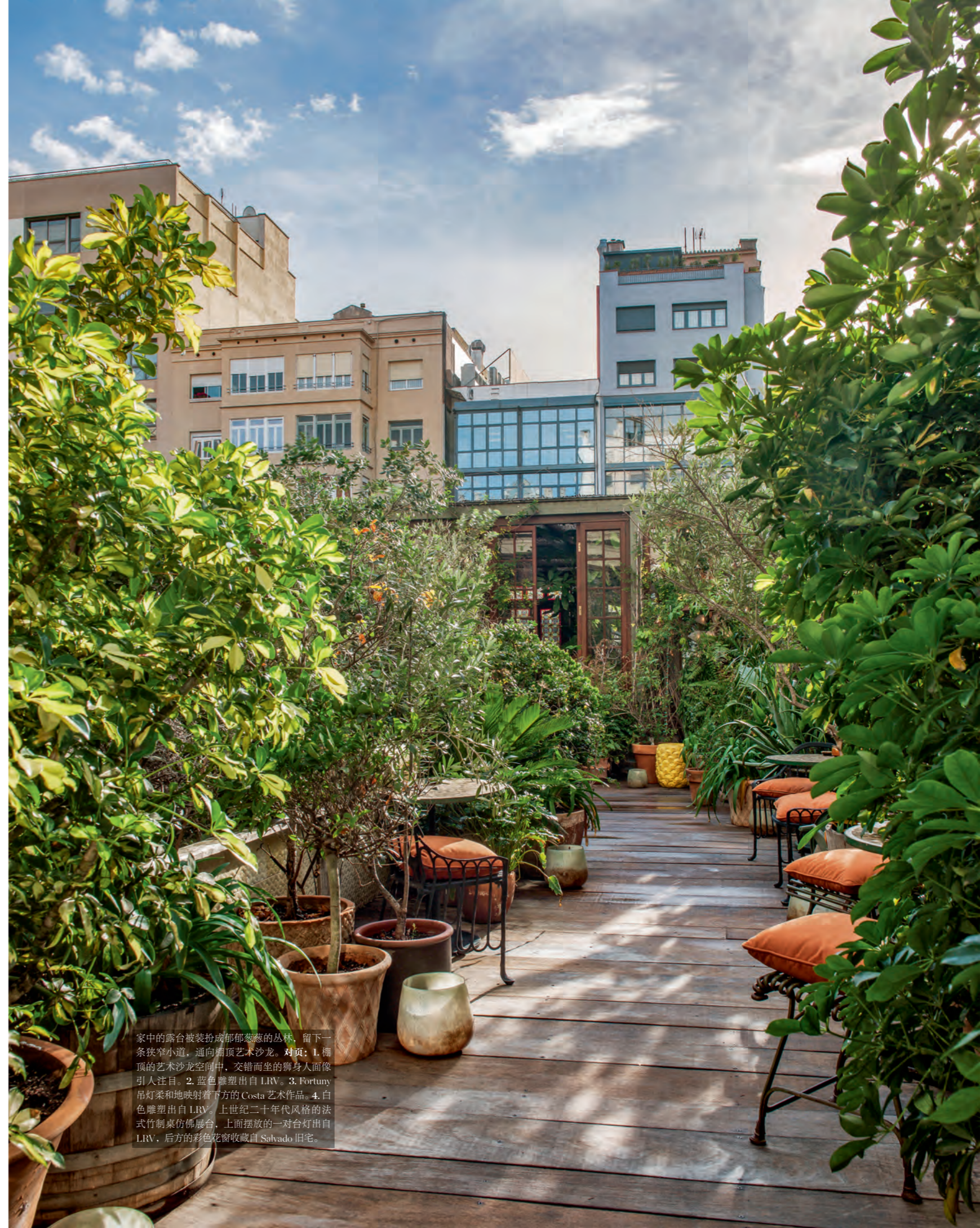
家中的露台被装扮成郁郁葱葱的丛林，留下一条狭窄小道，通向檐顶艺术沙龙。对页：1. 檐顶的艺术沙龙空间中，交错而坐的狮身人面像引人注目。2. 蓝色雕塑出自 LRV。3. Fortuny 吊灯柔和地映照着下方的 Costa 艺术作品。4. 白色雕塑出自 LRV。上世纪二十年代风格的法式竹制桌仿佛展台，上面摆放的一对台灯出自 LRV，后方的彩色花窗收藏自 Salvado 旧宅。