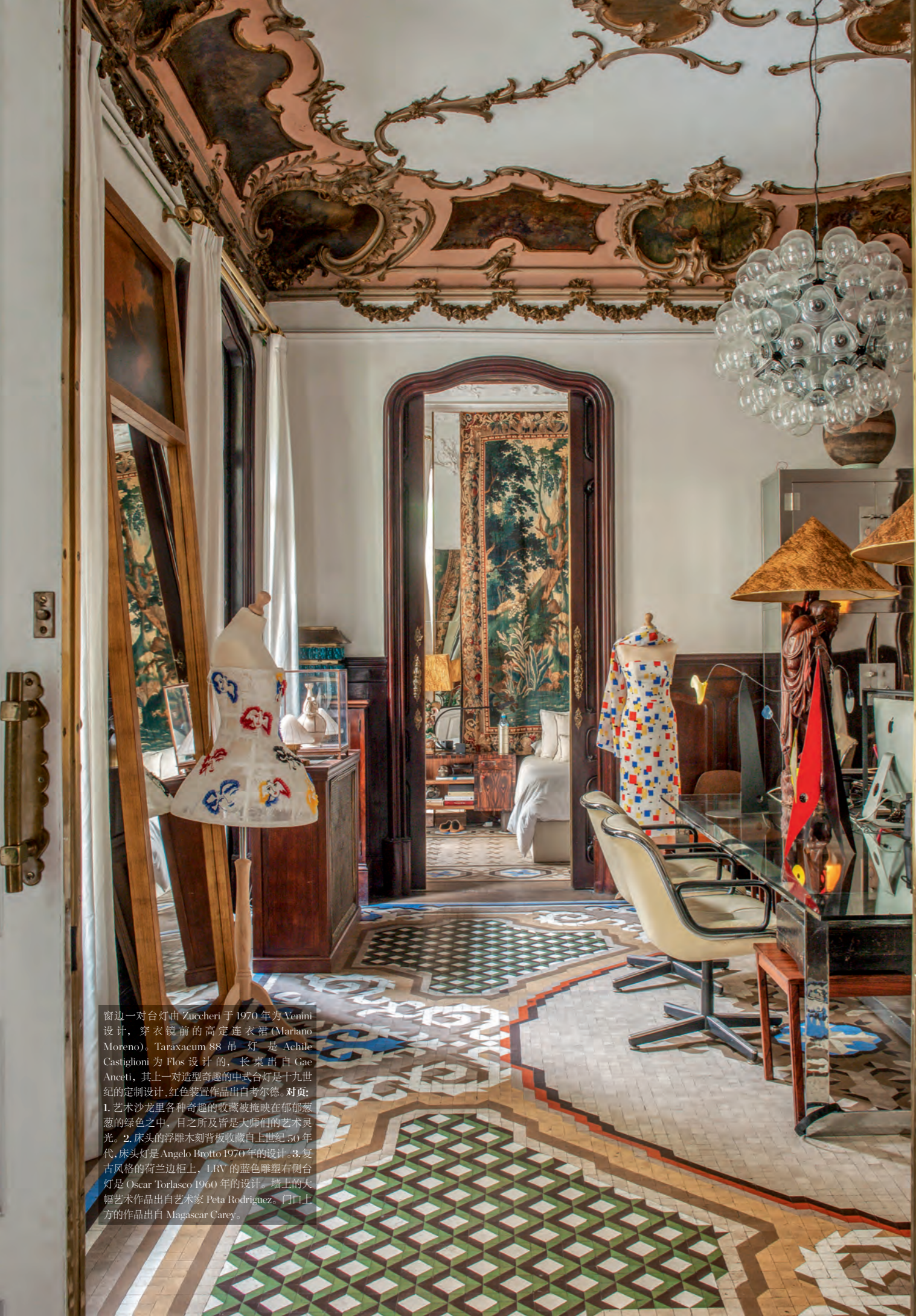
窗边一对台灯由 Zuccheri 于 1970 年为 Venini 设计，穿衣镜前的高定连衣裙 (Mariano Moreno)。Taraxacum 88 吊灯是 Achille Castiglioni 为 Flos 设计的，长桌出自 Gae Aulenti，其上一对造型奇趣的中式台灯是十九世纪的定制设计，红色装置作品出自考尔德。对页：1. 艺术沙龙里各种奇趣的收藏被掩映在郁郁葱葱的绿色之中，目之所及皆是大师们的艺术灵光。2. 床头的浮雕木刻背板收藏自上世纪 50 年代，床头灯是 Angelo Brogno 1970 年的设计。3. 复古风格的荷兰边柜上，LIV 的蓝色雕塑右侧台灯是 Oscar Torlasco 1960 年的设计。墙上的大幅艺术作品出自艺术家 Peta Rodriguez。门口上方的作品出自 Magascar Carey。