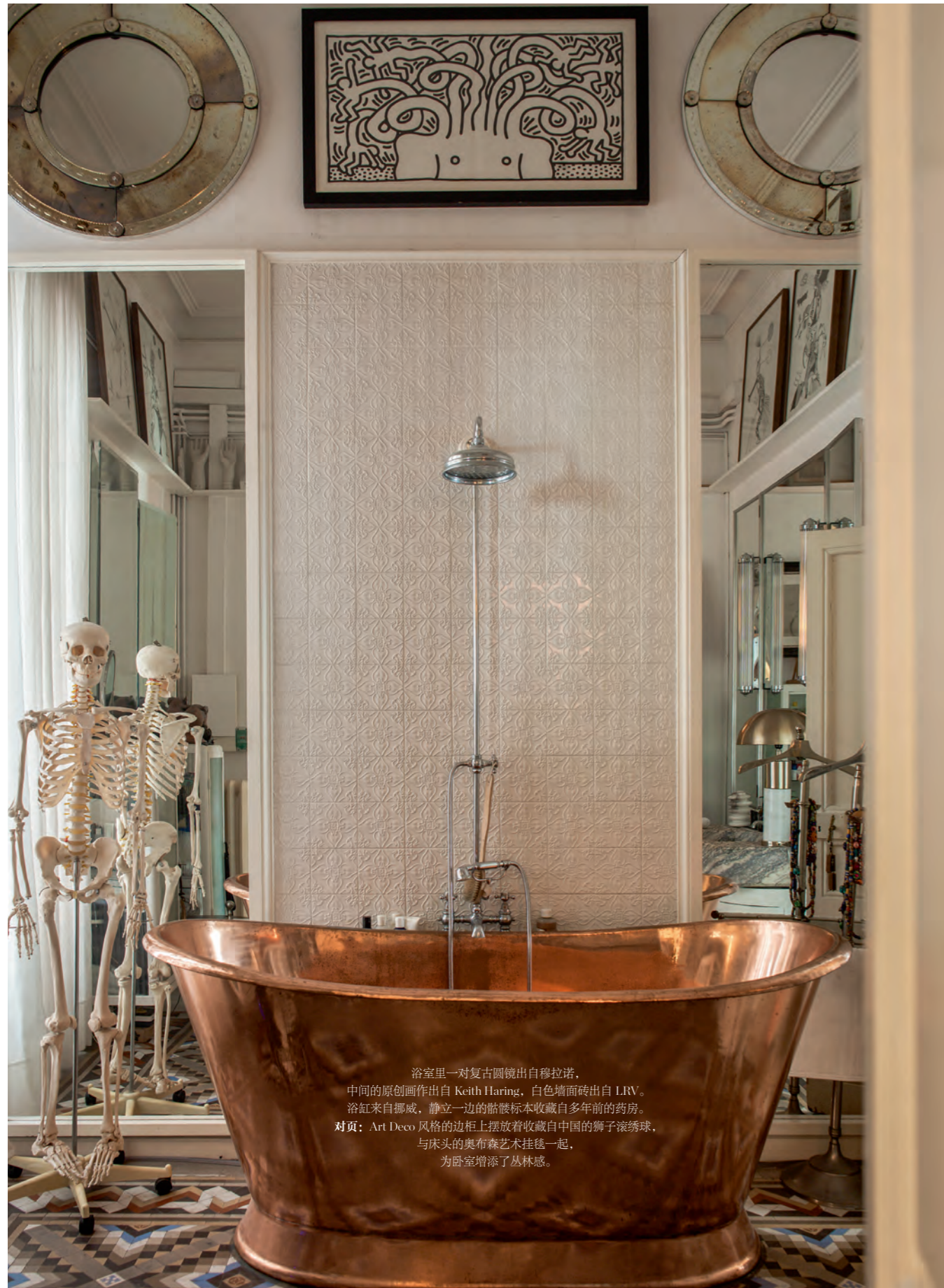
浴室里一对复古圆镜出自穆拉诺， 中间的原创作出自 Keith Haring，白色墙面砖出自 LRV。 浴缸来自挪威，静立一边的骷髅标本收藏自多年前的药房。 对页：Art Deco 风格的边柜上摆放着收藏自中国的狮子滚绣球， 与床头的奥布森艺术挂毯一起， 为卧室增添了丛林感。