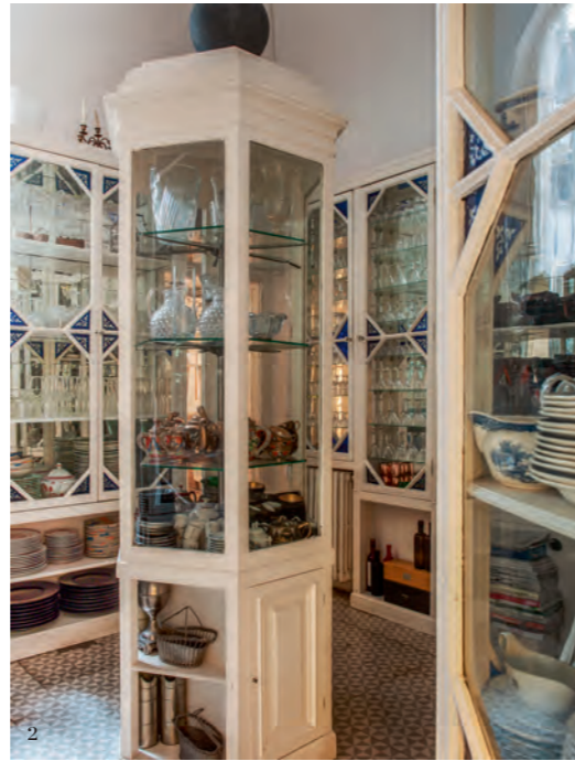
1. 厨房墙上挂着考尔德的艺术作品。炉灶后方的墙面瓷砖出自高迪。操作台前是两只苏格兰风格的吧凳。2. 与厨房相连的杯碟储藏室曾是老教堂的一部分，中间的收纳柜出自 Juli Battlevell 和 Arus，原本是 Salvado 药房的柜子。对页：从客厅看向厨房，最左边的图腾木雕出自 LRV。东方融合风格的边桌上摆放着一幅达利的艺术作品。

贵族方能享用的古董瓷器。偶尔派对人数众多，此处还身兼吧台功能，置身其中，很难不被其精美的程度所震撼。