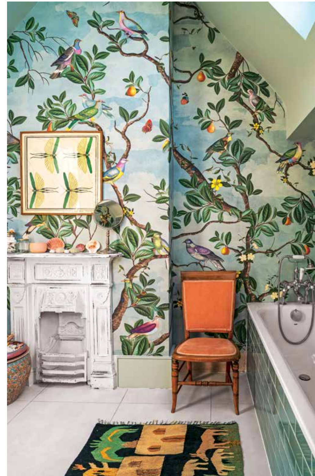
TOCCO SHABBY-RÉTRO Il caminetto in ghisa non più in uso, è stato dipinto di bianco.